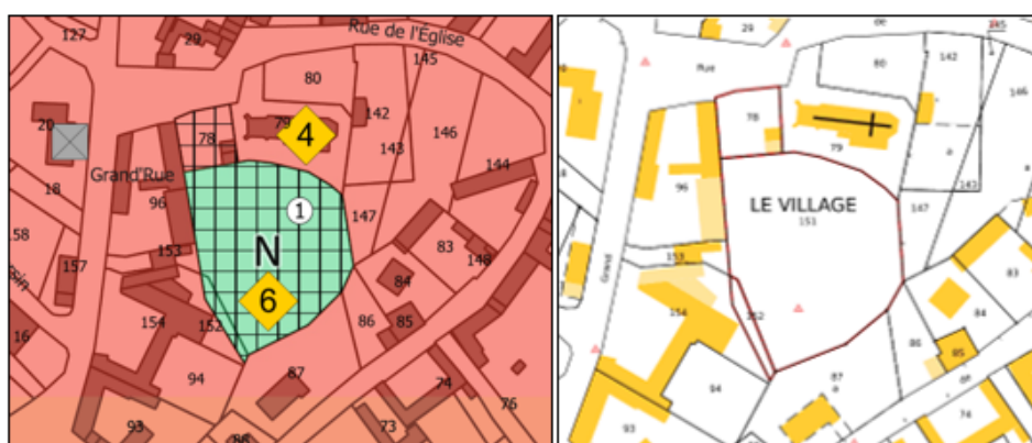
Extrait du plan de zonage de la commune de Humbercamps et extrait du cadastre

Il s'agit d'un emplacement réservé pour l'aménagement et la valorisation de la motte féodale des fins touristiques et culturelles, d'une surface de 3018 m 2 , situé sur les parcelles cadastrales A 78, AA 151 et AA 152.