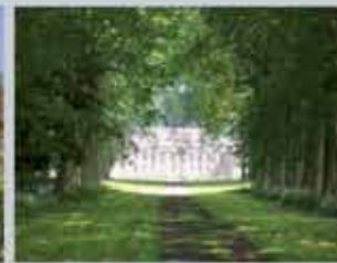
Château - Le Cauroy