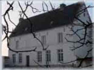
Ancien prieuré. Restauré, il accueille aujourd'hui la mairie de Grand-Rullecourt