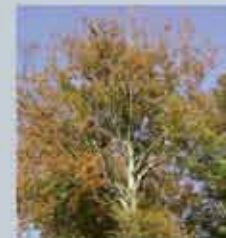
Ramure d'un hêtre en automne