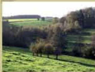
Vallée de la Grouche