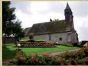
Sainte-Marie-Madeleine Eglise de Warluzel

La Coule et la Grouche prennent leur source à proximité du sentier. La Coule, cours d'eau irrégulier, est un affluent de la Grouche qui se jette dans l'Authie à Doullens.