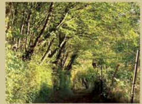
Fossé de la Coule