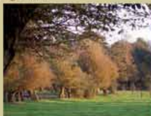
Haie de charmes têtards

10. Au bout de la rue continuer sur le chemin de terre qui descend vers le vallon qui longe du fossé de la Coule. Ce fossé a été creusé par le passage de la Coule qui est aujourd'hui très irrégulière.