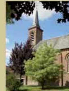
Eglise Saint-Thomas de Cantorbéry à Couturelle