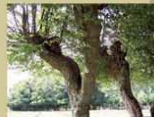
Taille d'un arbre qualifié de têtard

12. Prendre à gauche la rue du château. Vous passez à côté de l'église consacrée à Saint-Thomas de Cantorbéry. Vous longez des murs d'enceinte traités en rouge-barre (alternance de briques et de pierres) protégeant un château daté du début du XVIIIe s. Continuer jusqu'au croisement de la D23E et emprunter le chemin de terre face à vous.