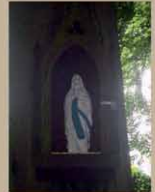
L'arbre à la Vierge

Durant la Seconde Guerre mondiale, des bombes, destinées à dévaster la ville de Doullens, sont tombées sur Pas-en-Artois. Par miracle, les bombes se sont écrasées autour du gros chêne portant la statue de la Vierge.