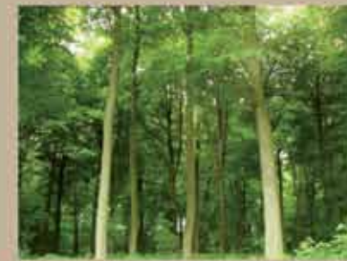
Bois du Chatelet