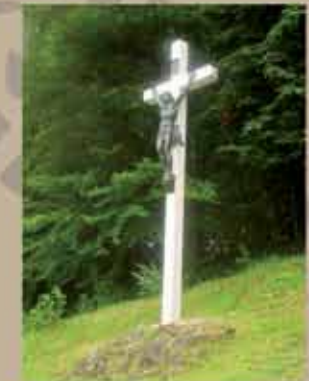
Calvaire du Bois Saint-Pierre

Pas-en-Artois possédait 3 églises. Saint-Martin datée du XVIII ème siècle est la seule qui ait été préservée. Le gracieux clocher est classé à l'inventaire des Monuments Historiques. Les vitraux du XIX ème siècle sont l'oeuvre de Félix Courmont (maître-verrier à Arras).