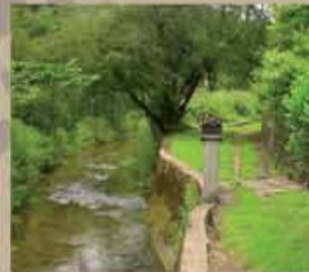
Les cours d'eau

Pas-en-Artois est traversé par la Kilienne prenant sa source à Warlincourt-lès-Pas. Ce cours d'eau était aussi appelé ruisseau de Pas.